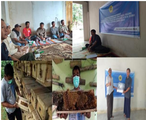
Gambar 2. Suasana Penyuluhan dan Pelatihan Kegiatan Pengabdian kepada Masyarakat di Desa Sedau Kecamatan Narmada Kabupaten Lombok Barat

Setelah penyuluhan dilaksanakan, dilanjutkan dengan pelatihan teknis pengambilan dan pengelolaan madu, serta penyerahan kenang-kenangan dari tim penyuluh epada perwakilan kelompok. Suasana penyuluhan dan pelatihan disajikan pada Gambar 2 berikut.